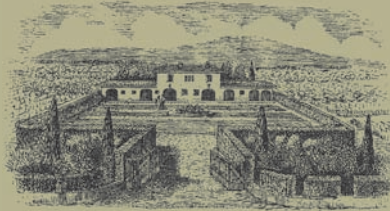
Veduta dell'azienda agricola Casale del Giglio alle Ferriere

CASALE DEL GIGLIO SOCIETÀ AGRICOLA S.R.L.