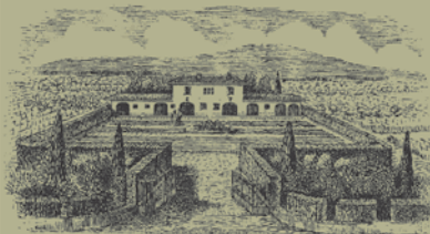
Valuta dell'azienda agricola Casale del Giglio alle Ferriere

CASALE DEL GIGLIO AZIENDA AGRICOLA S.R.L.